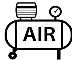
エアーコンプレッサー